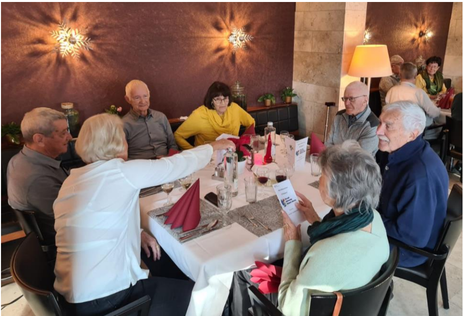
Schlusshock im Restaurant Riesbach