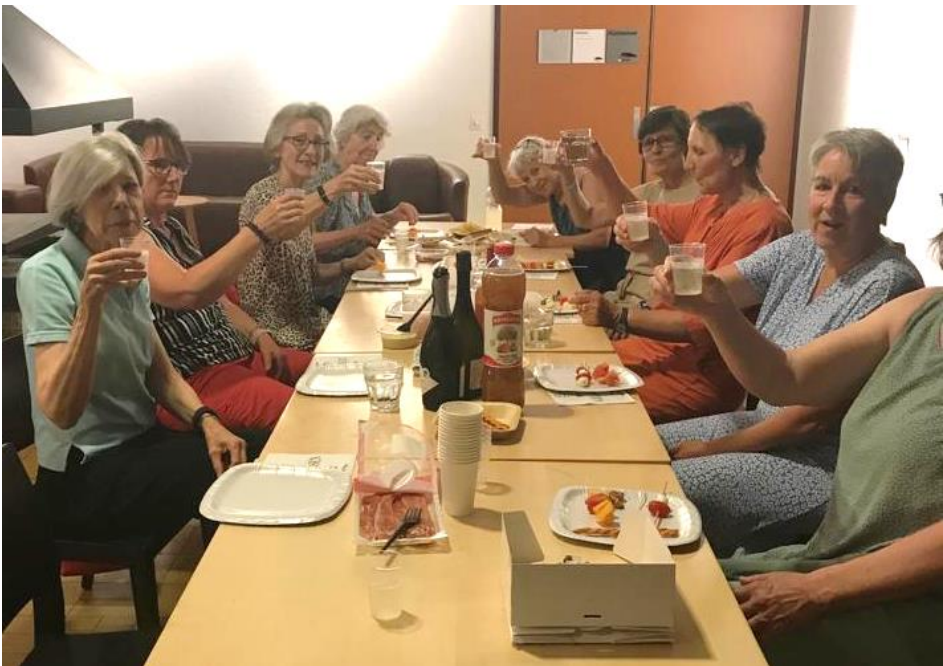
Die Frauen jeweils vor den Ferien im GZ Riesbach