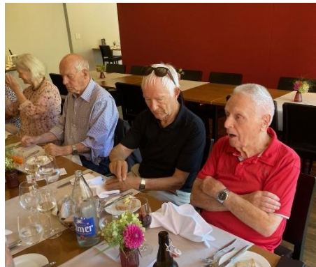
Gemeinsames Essen in Filzbach.