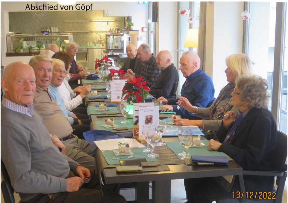
Abschied von Göpf