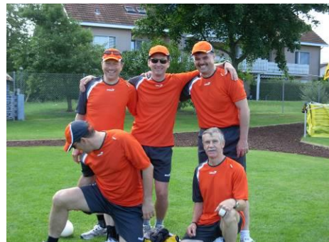
ETF 2012 Frauenfeld