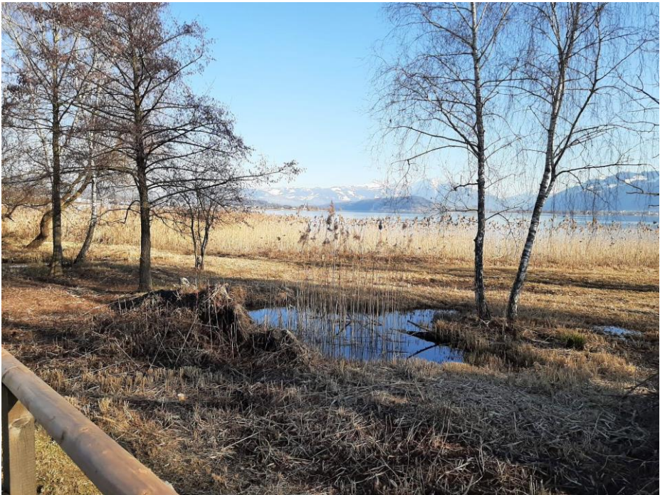
Die verdiente Ruhe in Rapperswil.