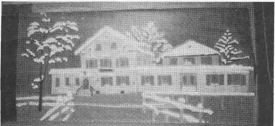
Bühnenbild im Schützenhaus Rehalp