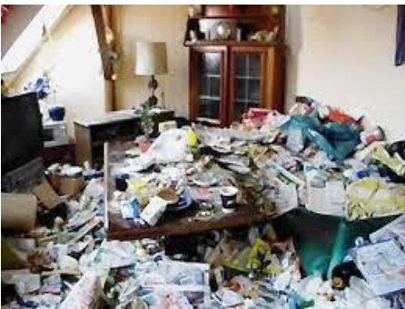
Halt wieder einmal aufräumen...

«Lieber Göpf und liebe Turnkameraden, Ja, es sind wirklich einschneidende Massnahmen die uns treffen! Der Zuhause-Arrest ist schon nach ziemlich kurzer Zeit eine psychologisch schwierige Belastung. Zum Glück gehöre ich auch noch ein bisschen der Nachkriegsgeneration an. Denn ein Merkmal oder eine Stärke dieser Generation ist das Aushalten. Also flexibel und kreativ sein ist angesagt à «wäge dem ghat d'Wält nöd under».