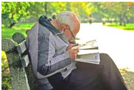
die Zeitung studieren...