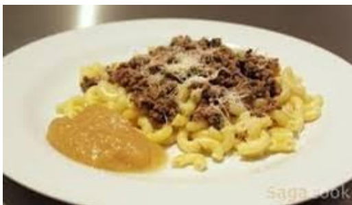
etwas feines kochen...