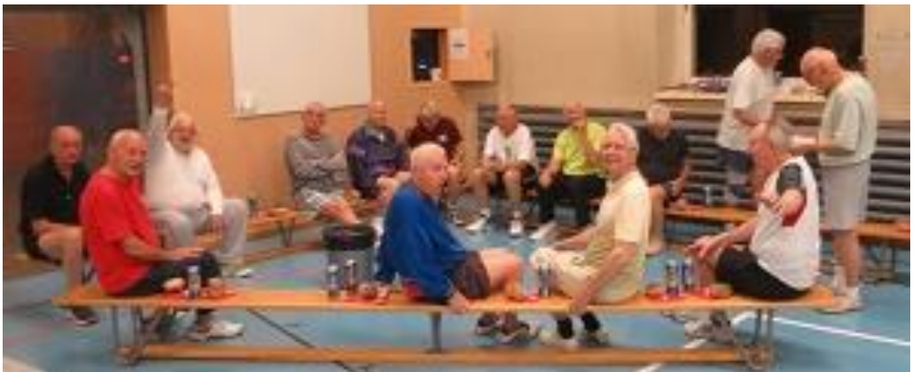
Die Belohnung für alle – Wurst Brot und ein Bier