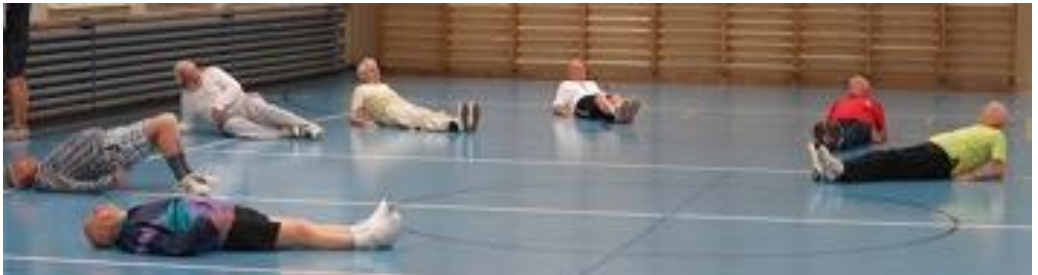
Jeder macht was er kann