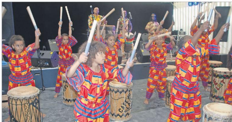
Die afrikanische Tanz- und Trommelgruppe Café au Lait brachte Riesbach zum Beben.