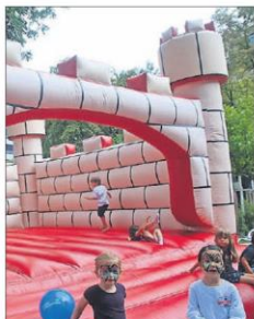
Austoben auf der Hüpfburg war trotz Hitze dringend nötig.