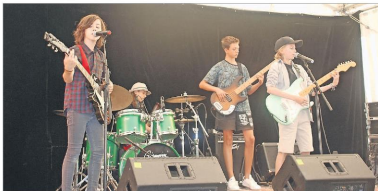
Keiner zu klein, ein Rocker zu sein: Die Teenager-Rockgruppe Blue Hotel lässt es krachen.

Gemäss OK-Präsident Markus Neukom soll beim Riesbachfest ein umfangreiches Programm im Vordergrund stehen. «Es wird besonders auf Vielfältigkeit geachtet», meint er. Ziel ist es, den Besuchern eine er-