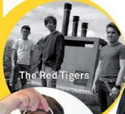
The Red Tigers