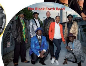
The Black Earth Band