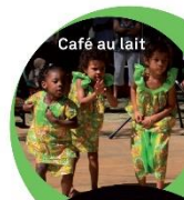
Café au lait